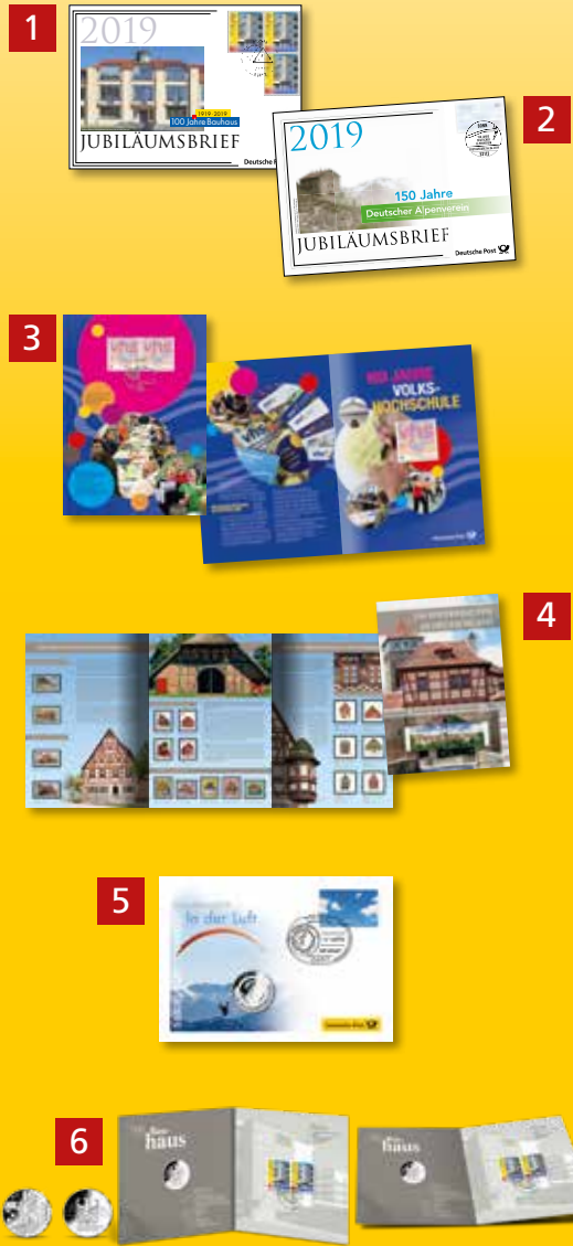
Alle Abb. Muster.